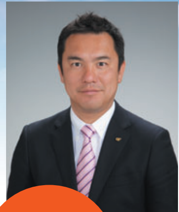
鈴木英敬 三重県知事 パネリストとして 参加いたします!