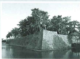
津城跡(三重県指定史跡)