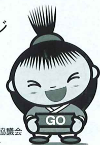
大河ドラマ「江」地域活性化推進協議会公認キャラクター

FAXお申し込み用紙 送り先 FAX: 059-228-7317 (津商工会議所)