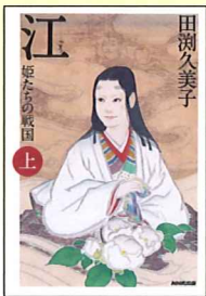
「江」姫たちの戦国 原作 田淵久美子 NHK出版