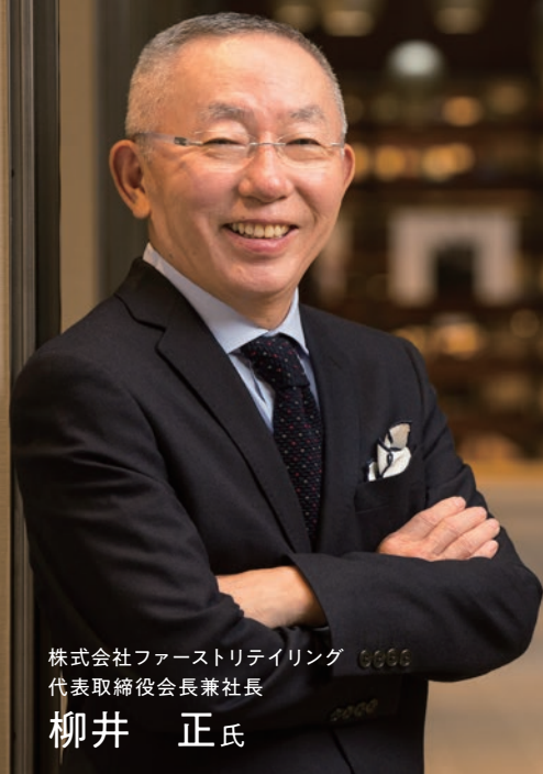
株式会社ファーストリテイリング 代表取締役会長兼社長 柳井 正氏

コロナ禍で奮闘している会員企業、地域の最前線で会員企業を支援している各地商工会議所が、ともに未来への希望を持って、これからの時代を生き抜いてくために、各方面で活躍されている方々をお招きし、オンラインによる特別記念講演会を開催します。