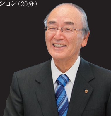
日本商工会議所 三村明夫会頭